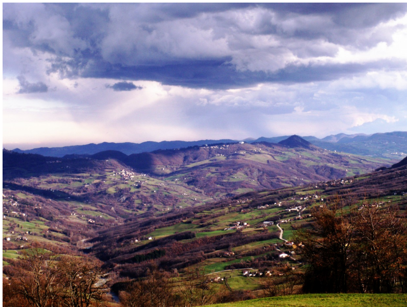
La vallée du Scoltenna, vue de Lama Mocogno

Lama Mocogno est une Commune italienne de 2683 habitants au coeur de la montagne de la Province de Modène, en Emilia Romagna, faisant partie de l'ancien territoire du Frignano, peuplé – avant la conquête romaine – par les Ligures Friniates , qui, selon Dominique François Louis Roget de Belloguet et d'autres historiens et anthropologues, appartenaient à la civilisation celtique (gauloise). Les principaux témoignages archéologiques de la présence de ce peuple sont constitués par les inscriptions murales sur le mégalithe dit "Pont d'Hercule" ou "Pont du Diable", un rocher avec une silhouette singulière de pont naturel qui surgit parmi les bois près de Lama Mocogno, et qui fait l'objet de contes et légendes.