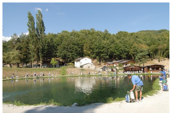
Moulin des Campore, Valdalbero de Lama Mocogno