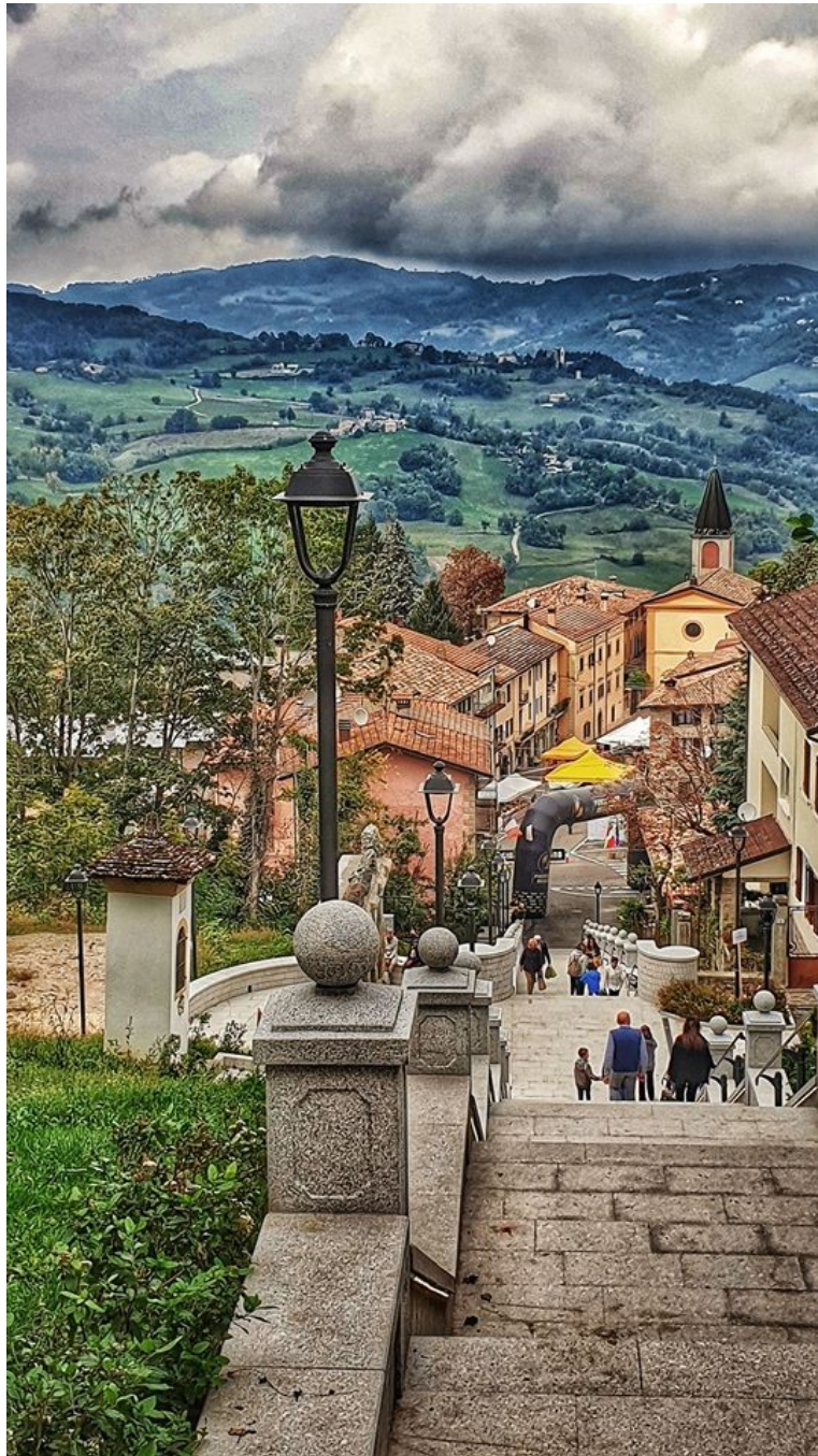
Lama Mocogno, la "Scalinata", escalier monumental bâti en 1932-33, restauré en 2017-2019

Plusieurs sont les associations, notamment les clubs sportifs (Ac Lama calcio pour le football, Olympic Lama pour le ski, Gruppo Ruzzola Lama Mocogno pour le jeu de la "ruzzola", c'est à dire le lancement d'un disc en bois façonné comme une roue, mais anciennement il s'agissait d'un fromage), les associations de bénévoles (Avpa pour l'assistance publique, Avis pour la collecte de sang) et culturelles (Gruppo folcloristico di Barigazzo pour la musique et les danses traditionnelles, Banda musicale "Gioacchino Rossini", fanfare et école de musique active dès 1890).