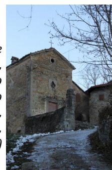
La chapelle de Casarola, à Pianorso (oratorio di Casarola, Pianorso, Lama Mocogno)

Mocogno, où eurent lieu des faits d'armes au XVI e siècle, possédait un château, brûlé en 1523 par une armée du duc de Ferrare, Alfonso I d'Este, époux de Lucrece Borgia: c'est l'événement qui a originé le blason municipal (un château qui brûle, avec trois lames d'eau) de Lama Mocogno. D'autres églises se trouvent à Barigazzo, Vaglio, Cadignano. Plusieurs sont les oratoires et les chapelles.