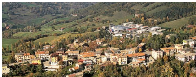
Lama Mocogno, le chef-lieu

Nombreux sont les sentiers de randonnée dans l'entier territoire municipal, en particulier à La Santona, Barigazzo, Le Piane, mais le plus important est sans doute celui de l'ancienne route Vandelli (1752), voulue par Francois III, duc de Modène, pour unir la Toscane et la Lombardie en franchissant les Appennins: en plein XVIII siècle, il s'agissait de la première route moderne d'Europe, réalisée grâce à l'invention des courbes isohypses. Cette route et la suivante route Giardini-Ximenes – qui la substitua dès 1781, en reliant la plaine du Po et le port toscan de Livourne – permirent le développement de la montagne modenaise et de l'actuel chef-lieu de la Commune de Lama Mocogno, au lieu des anciens villages et châteaux.