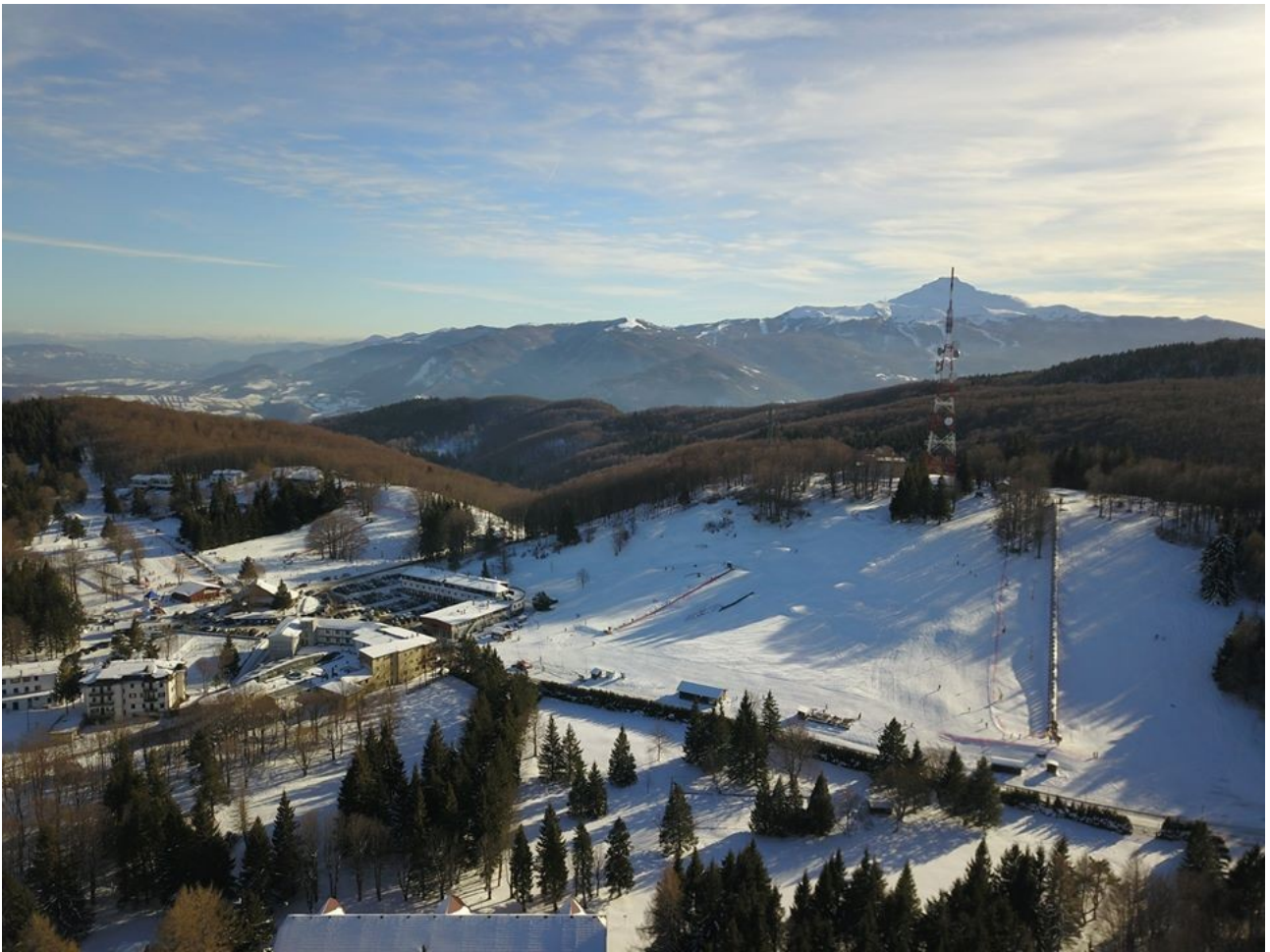
Piane di Mocogno, le centre pour le ski de fond