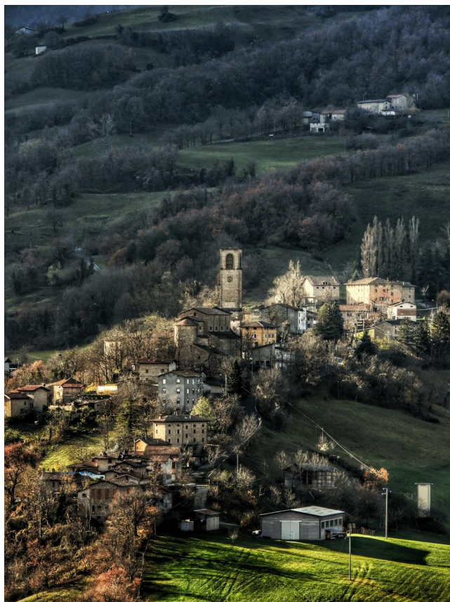
Mocogno, le site de l'ancien château (brûlé en 1523), Lama Mocogno

Les églises du territoire communal sont aussi à voir, en particulier celle de Pianorso – du XVII e siècle – avec le retable des Saints Pierre et Paul du peintre Gian Gherardo delle Catene (XVI e siècle) et l'église de Mocogno, ancien chief lieu, où naquit le bienheureux Marco da Modena, de l'ordre des Prêcheurs (ou Dominicains).