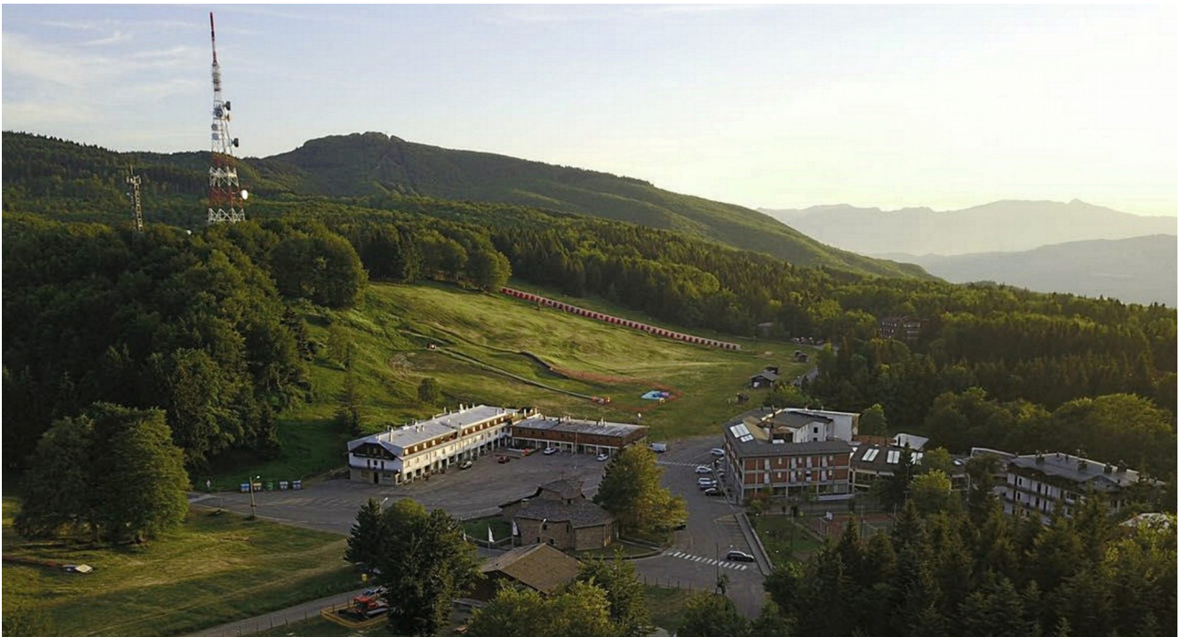
Piane di Mocogno

Concernant l'âge romain, plusieurs fouilles archéologiques ont permis, dans les décennies passées, de découvrir des monnaies romaines, des morceaux de céramique, des briques et des tuiles, en particulier près du Pont d'Hercule, à côté du "Mont Apollon" (Monte Apollo ou Poggio Pennone) et près du plateau des actuelles "Piane di Mocogno" (Plateau de Mocogno), à environ 1200 mètres d'altitude, un plateau anciennement connu comme "Piana delle Are" (Plateau des Autels) pour la présence de lieux de culte païens, jadis endroit de bergers et d'éleveurs de chevaux, devenu maintenant un renommé centre pour le ski de fond (Centro Federale FIS Lama Mocogno), dominé par le Monte Cantiere (1617 mètres).