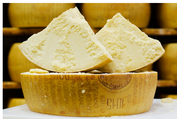
Les produits agro-alimentaires

Il y a une institution scolaire, l'Istituto Comprensivo "G. Dossetti", avec école maternelle, école primaire et collège (où les élèves apprennent le français et l'anglais), tandis que les lycéens fréquentent pour la plupart les institutions de la proche ville de Pavullo nel Frignano et les universitaires étudient à Modène ou à Bologne.