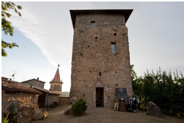
La tour de Montecenere, Lama Mocogno

La tour de Montecenere, restauré en 1998, qui abrite une exposition muséale sur l'ancienne famille féodale des Montecuccoli – dont deux, Ernesto et Raimondo, furent généraux des Habsbourg pendant la Guerre de Trentes Ans – et les morceaux de la tour de Sassostorno sont les deux témoignages principaux du moyen âge, liés au château de Montecuccolo, dans la commune voisine de Pavullo, berceau de la famille qui domina pendant plus de six siècles la plupart de la montagne modenaise. La tour fut assiégée en 1512 par les espagnols et défendue par les milices des Montecuccoli, aux ordres de Camilla Pico, femme du comte Frignano Montecuccoli.