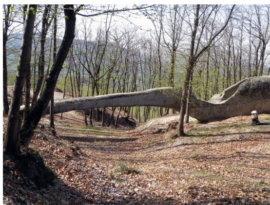
Le Pont d'Hercule (ou Pont du Diable)

Lama Mocogno se trouve à 842 mètres d'altitude, sur un crinal qui sépare la vallée du fleuve Scoltenna du bassin du fleuve Rossenna: deux noms étrusques qui rappellent la domination de ce peuple provenant de la Toscane, avant l'expansion de Rome républicaine dans nos pays.