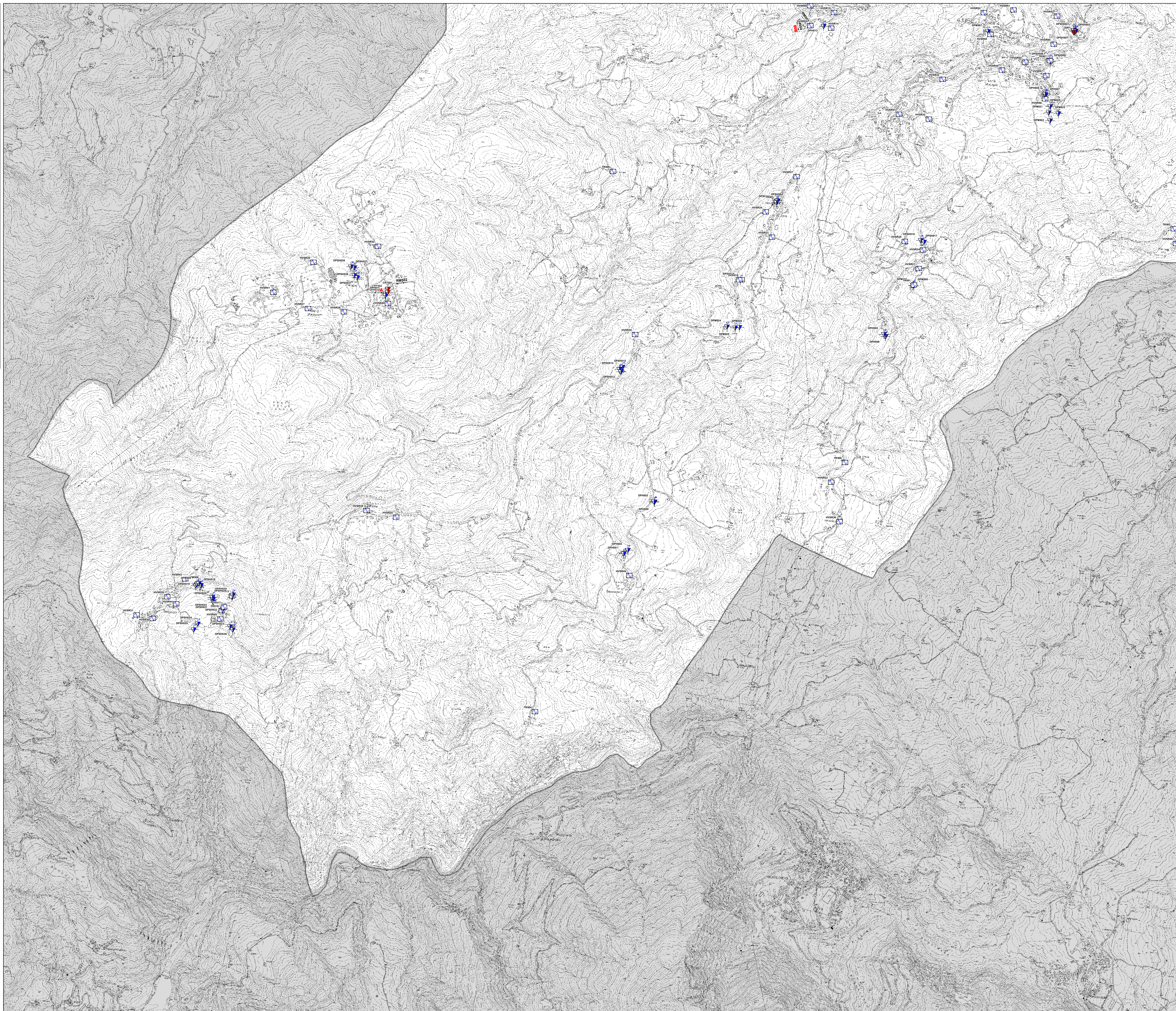
TAVOLA 2 DI 2